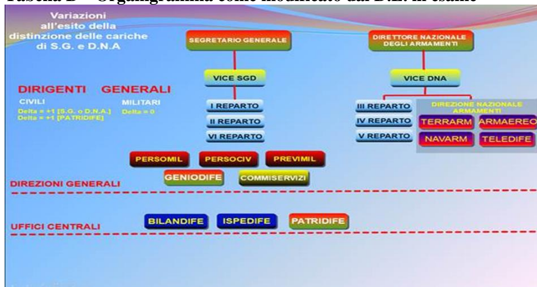
Tabella B – Organigramma come modificato dal D.L. in esame