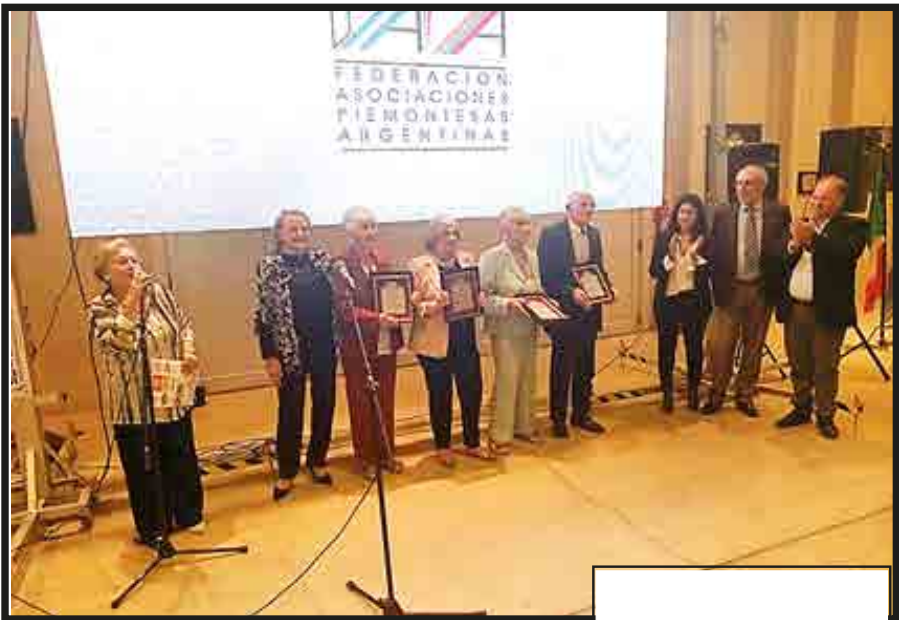
Las 4 personas Distinguidas con el Premio Piemontés Destacado 2024 ¡Felicitaciones!